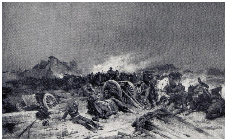
Bataille de Beaune-la-Rolande, tableau de Wilfrid-Constant Beauquesne.

Il est à noter enfin qu'une grande partie des dossiers concernant la guerre de 1870 ont disparu dans l'incendie des Archives départementales en juin 1940 : mobilisation de la Garde nationale, levée de troupes (1870-1871) ; contributions et réquisitions (1870-1877) ; occupation d'Orléans (1870-1871) ; états des pertes et dommages de guerre (1870-1876). Mais on peut souvent en retrouver le reflet ou le pendant dans les archives des communes.