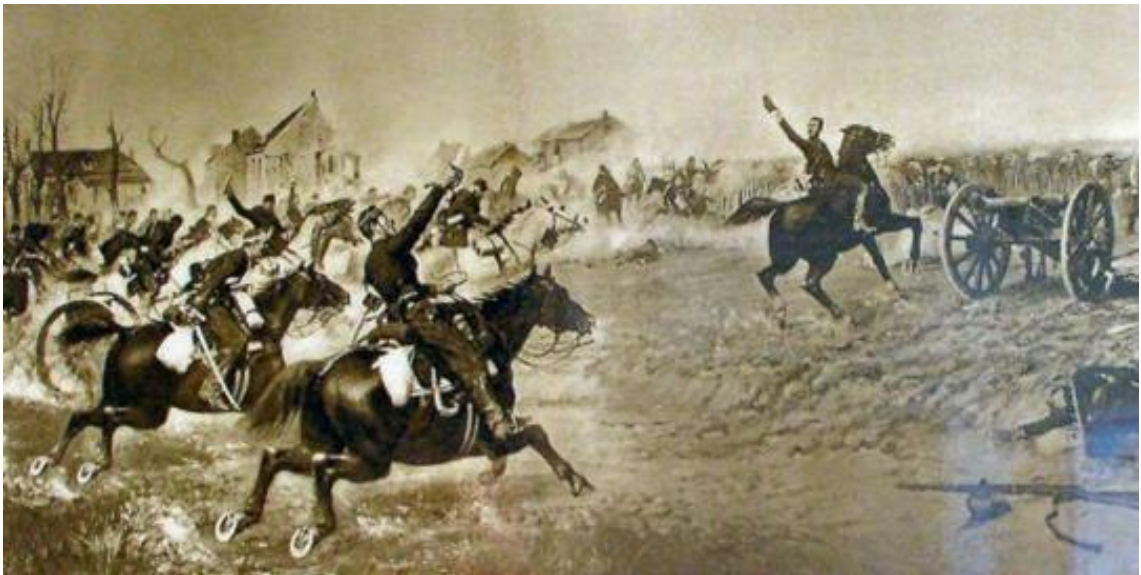
Combat de Juranville le 28 novembre 1870, tableau de G. Claris