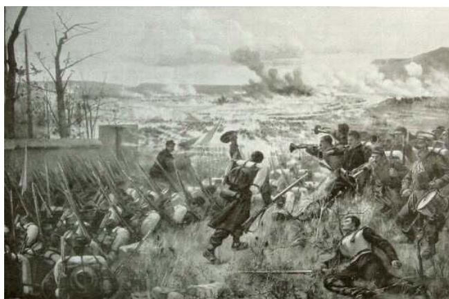
Salut à la victoire (Coulmiers), tableau d'Étienne Dujardin-Beaumetz.

Il n'est donc que justice que l'on se souvienne de ce conflit, et d'autant plus qu'Orléans et l'Orléanais furent le théâtre même d'opérations militaires qui marquèrent durablement et la mémoire des populations locales et le « roman national » de la Troisième République. La géographie du département se lit à travers les champs de bataille : combats de Toury, de Patay, de Loigny, de Saint-Péravy-la-Colombe ou d'Artenay, victoire de Coulmiers, bataille de Beaune-la-Rolande, occupation d'Orléans, incendie de Châteaudun, avec pour fil rouge une Armée de la Loire au courage héroïque. L'invasion et l'occupation par les Prussiens et les Bavarois ravivèrent dans la population loirétaine les douloureux souvenirs laissés par les Cosaques et les Prussiens à peine plus d'un demi-siècle plus tôt.