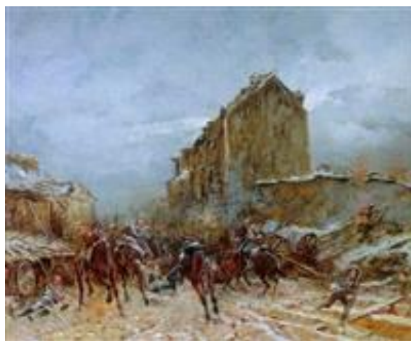
Les ublans à Beaugency, par Beauquesne