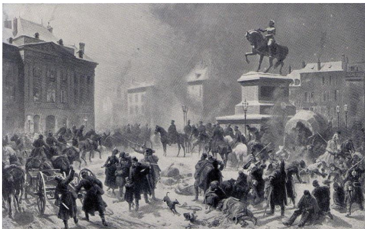
Entrée des Allemands à Orléans, tableau de Ludwig Braun

L'état documentaire est complété par une orientation bibliographique singulièrement riche. Dans la foulée des événements, la guerre a été en effet le sujet de très nombreuses publications avec la volonté de tirer les leçons de la défaite dans une démarche de redressement national et de réforme de la pensée militaire.