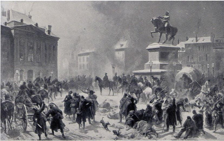
Entrée des Allemands à Orléans, tableau de Ludwig Braun

L'état documentaire est complété par une orientation bibliographique singulièrement riche. Dans la foulée des événements, la guerre a été en effet le sujet de très nombreuses publications avec la volonté de tirer les leçons de la défaite dans une démarche de redressement national et de réforme de la pensée militaire.