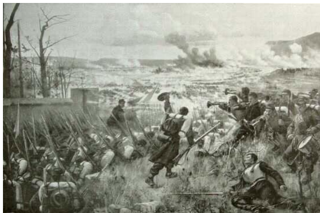
Salut à la victoire (Coulmiers), tableau d'Étienne Dujardin-Beaumez.

Il n'est donc que justice que l'on se souvienne de ce conflit, et d'autant plus qu'Orléans et l'Orléanais furent le théâtre même d'opérations militaires qui marquèrent durablement et la mémoire des populations locales et le « roman national » de la Troisième République. La géographie du département se lit à travers les champs de bataille : combats de Toury, de Patay, de Loigny, de Saint-Péravy-la-Colombe ou d'Artenay, victoire de Coulmiers, bataille de Beaune-la-Rolande, occupation d'Orléans, incendie de Châteaudun, avec pour fil rouge une Armée de la Loire au courage héroïque. L'invasion et l'occupation par les Prussiens et les Bavarois ravivèrent dans la population loirétaine les douloureux souvenirs laissés par les Cosaques et les Prussiens à peine plus d'un demi-siècle plus tôt.