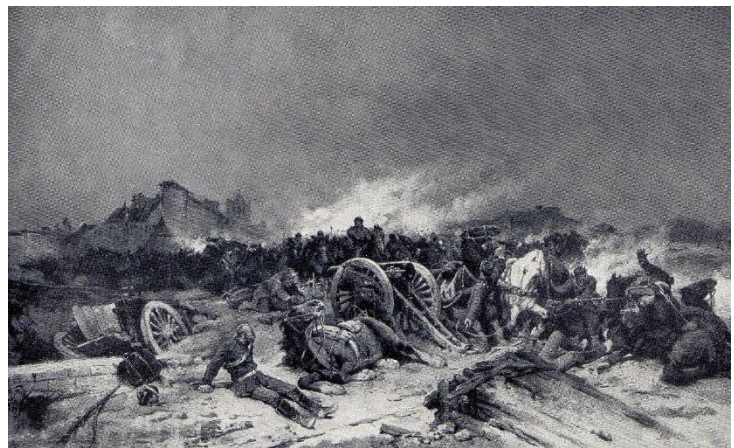
Bataille de Beanne-la-Rolande, tableau de Wilfrid-Constant Beauquesne.

Il est à noter enfin qu'une grande partie des dossiers concernant la guerre de 1870 ont disparu dans l'incendie des Archives départementales en juin 1940 : mobilisation de la Garde nationale, levée de troupes (1870-1871) ; contributions et réquisitions (1870-1877) ; occupation d'Orléans (1870-1871) ; états des pertes et dommages de guerre (1870-1876). Mais on peut souvent en retrouver le reflet ou le pendant dans les archives des communes.